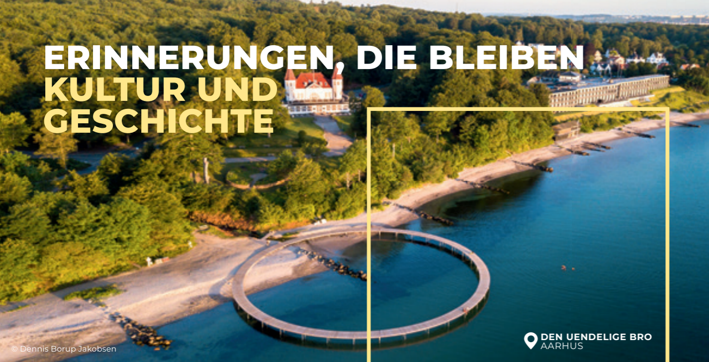
DEN UENDELIGE BRO AARHUS

AUS JEDER PERSPEKTIVE SPEKTAKULÄR: DAS BEGEBBARE BRÜCKEN-KUNST- WERK AUS HOLZ SORGT FÜR UNENDLICHE SCHÖNE STRANDSPAZIERGÄNGE.