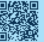
QR-Code scannen und Route planen