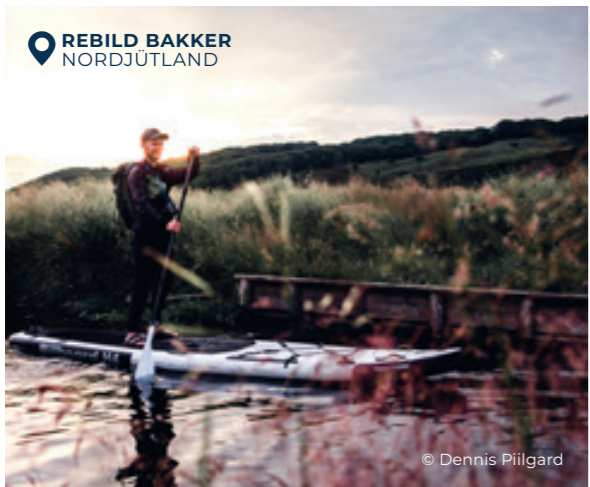
REBILD BAKKER NORDJÜTLAND

76.000 HA OUTDOOR-GLÜCK Lille Vildmose ist Dänemarks größtes geschütztes Wildreservat und gleichzeitig Nordeuropas größtes Hochmoorgebiet. Wir finden: Das muss