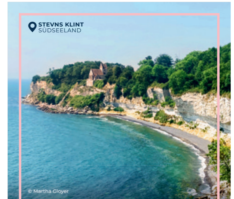
STEVNS KLINT SÜDSEELAND

Mit einer Seefahrt ins Urlaubsglück starten? Das ist an der dänischen Ostsee gar nicht so unüblich. Denn mit etwa 400 Inseln jeder Größenordnung steht in Dänemark einem entspannten Inselhopping nichts mehr im Wege. Ob Seeland, Møn, Anholt oder kleinere Lieblinge wie Læsø, Nyord und Endelave, die „Insel des Jahres 2020/21“ – freuen Sie sich auf pure Inselidylle und jede Menge frische Luft.