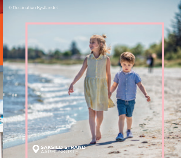
SAKSILD STRAND AARHUSKÜSTE

UNSERE FAMILIENFREUNDLICHEN STRÄNDE BIETEN RAUM FÜR ERHOLUNG UND UNBEKÜMMERTEN WASSERSPASS FÜR DIE KLEINSTEN.