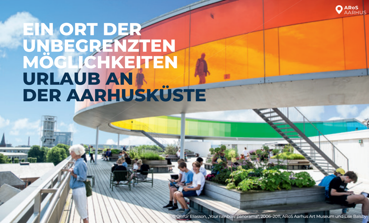
© Olafur Eliasson, „Your rainbow panorama“, 2006–2011, ARoS Aarhus Art Museum und Lise Balsby

Etwa 450 km Küstenstrecke und mehr als 100 Strände sowie eine tausendjährige Geschichte sprechen für sich: Aarhus und Umgebung sind perfekt für urlaubshungrige Natur- und Kulturliebhaber.